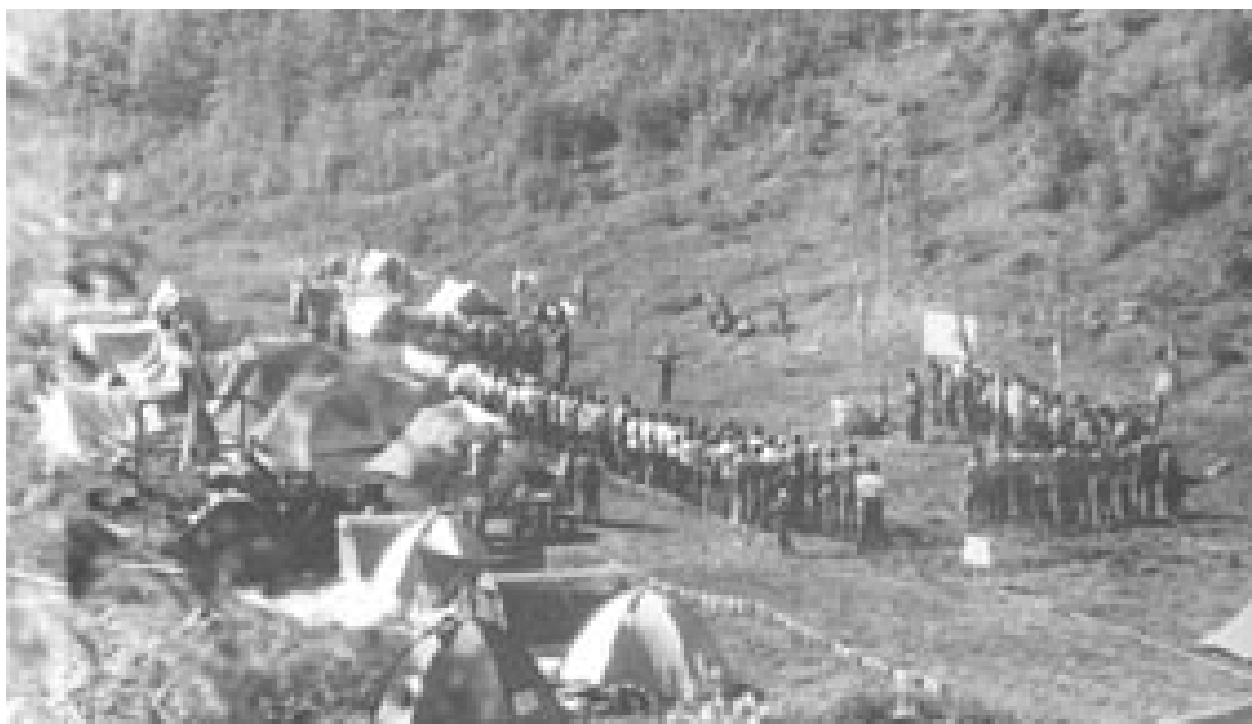
Фото.3. На открытии 10 матча

Фонды ОНИТСТЦ. Отчет. (Баранов С.М., Евдокимов С.С).