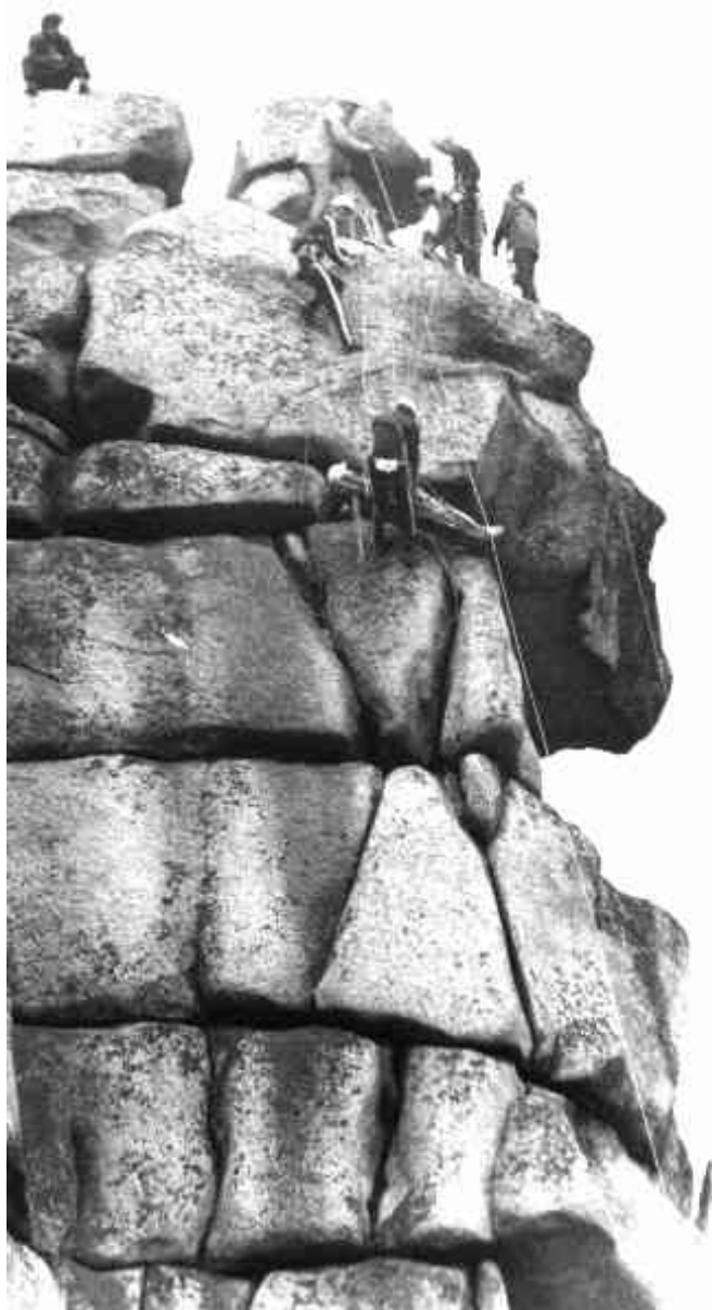
Фото.4. На дистанции спасательных работ 20 Матча. Ск.Шихан.

группа А группа В группа С КАСКА ИЛЮХИНА Челябинск 2 Екатеринбург Пермь-1 Челябинск-2 Нефтекамск Пермь Нефтекамск-1 Екатеринбург Челябинск-2 Челябинск Программа