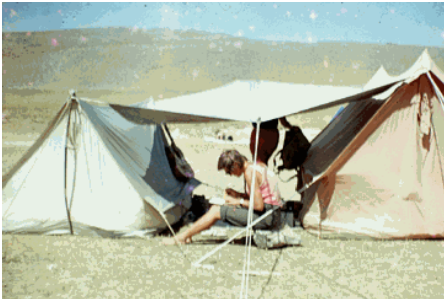
Палатки Пермского отряда на КиЛСИ

Лагерный быт строг и непритязателен: с утра - построение; ставятся задачи на день. Но прежде чем разойдутся в разные стороны рабочие группы экспедиции, звучит обязательная фраза: