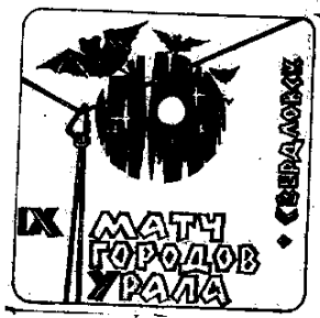
Рисунок эмблемы расположен в квадратной рамке 100х100мм. со скругленными углами. Фон рисунка – белый. В нижней части поля по центру в три строки надпись – «Матч городов Урала». Вдоль правой стороны вертикальная надпись «Свердловск». Из правого верхнего угла к верхней части левой

д.Коуровка, т.б. «Чусовая». Организаторы матча – г.Свердловск. К матчу был подготовлен эскиз эмблемы матча, которая украшала изготовлены пригласительные билеты участников матча и судейские папки с документацией.