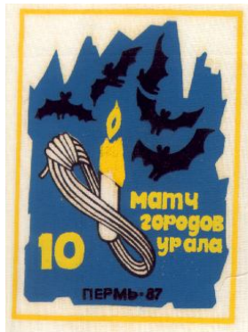
Рисунок эмблемы расположен в рамке толщиной 3мм. желтого цвета размером 85х116мм. На рисунке: под сводом сталактитовой пещеры (цвет белый) вьются вокруг пламени оплывающей свечи (желтый и белый), вставленной в сбухтованную веревку (черно- белый), пять летучих мышей (черные). Справа от свечи и бухты веревки надпись (желтая) в три строки: «Матч городов Урала». На уровне последнего слова, слева от бухты Увеличенная цифра «10». Внизу расположена черная надпись: «Пермь - 87».

Организаторы матча – г.Пермь. К матчу были изготовлены эмблемы участников по рисунку Пермского туриста Кодолова В.И. Эмблема изготовлена методом шелкографии на Х.Б. материале белого цвета.